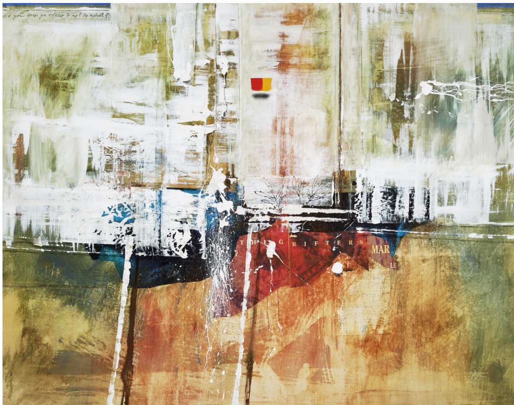
Robert Brandy, Did you ever go clear? no? So what? , 150x200 cm, technique mixte sur toile, 2007 © coll. Brandy – Photo: Tom Lucas / MNHA

Commissaires Kuratoren Curators : Malgorzata Nowara, Jamie Armstrong | Réalisation graphique Grafische Gestaltung Graphic design : A Designers' Collective