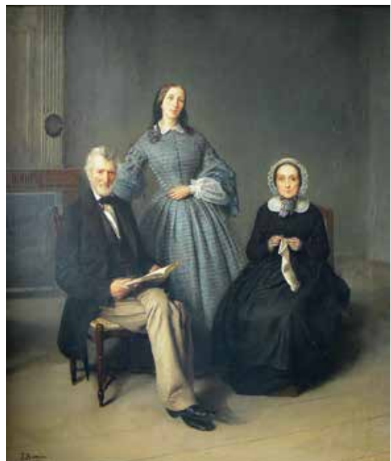
Ein ähnliches Werk befindet sich in der Sammlung des Museums in Annecy.