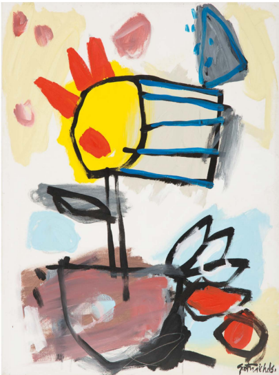
Untitled, 1992 © Gast Michels Estate

Réservation : servicedespublics@mnha.etat.lu