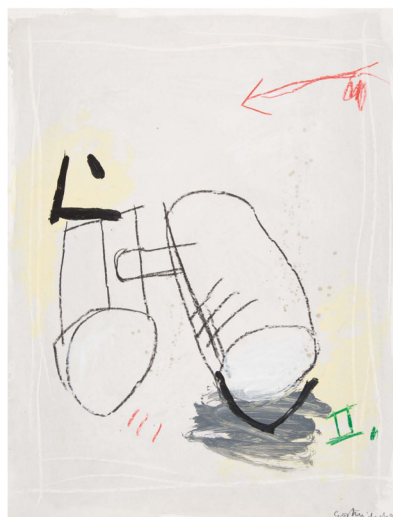
Pièce de rechange I, 1994

Réservation : servicedespublics@mnha.etat.lu