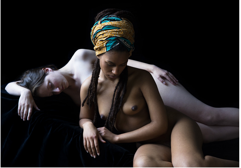
Carla van de Puttelaar Rembrandt Series , 2015 © Carla van de Puttelaar

cette rétrospective, Carla van de Puttelaar a spécialement créé des œuvres s'inspirant des collections de Maîtres anciens exposées au musée, comme la Pietà de l'artiste flamand Théodore van Loon. Plusieurs œuvres vont rester à la fin de l'exposition dans les collections de la Section des Beaux-Arts.