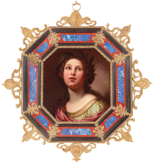
Felice Ficherelli (1605-1660), Allegory of Poetry