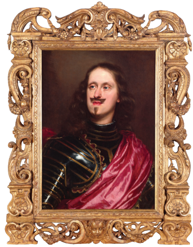
Justus Sustermans (1597-1681), Portrait of Giovan Carlo de' Medici (1611-1663) Commander of the Spanish fleet