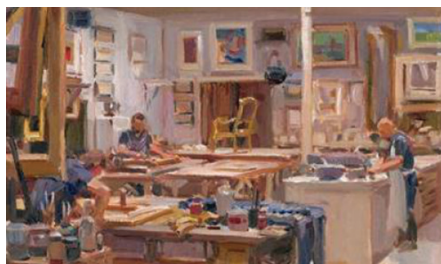
Hans Versfelt, Interior of the framer's workshop Gehring & Heijdenrijk, Amstelveen, 2019 . Private collection

Many paintings have been re-framed during their lifetime. When the original framing of a painting is sadly lost, how do we settle on a new frame today? Such decisions require us to delicately balance esthetics with art historical information, best based on research. Several examples illustrate how much the frame influences our experience of a painting.