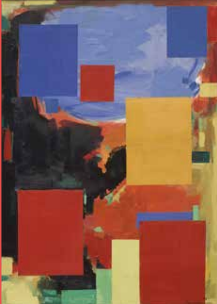
Hans Hofmann (1880-1966),

Goliath , 1960, University of California,