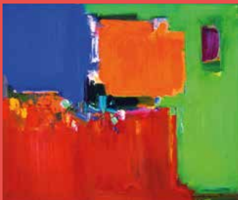
Hans Hofmann (1880-1966),

Les lycéens sont initiés à la production de peinture végétale et découvrent les couleurs, nuances et teintes existantes dans la nature. Ils apprennent comment les substances naturelles peuvent servir à composer des peintures et expérimentent avec différentes techniques et différents outils pour appliquer la peinture.