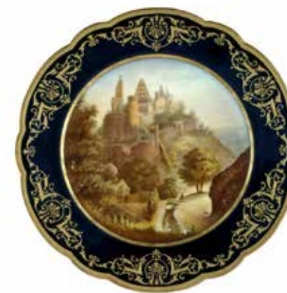
Zens frères Echternach, Vianden , 1884